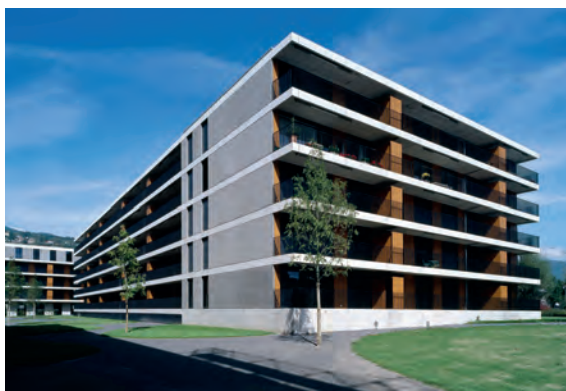
Schüssspark Biel: Erste Überbauung nach dem bonacasa®-Konzept.

diese umfassenden Services zielgruppengerecht zu nutzen, um einen echten Mehrwert im Wohnen zu ermöglichen. Eine Multimedia-Vernetzung in jeder Neubauwohnung bildet dabei die kostengünstige Basisinvestition, welche von Bewohnern in jedem Alter genutzt werden kann. Und speziell im Alter oder bei Behinderung für AAL. □