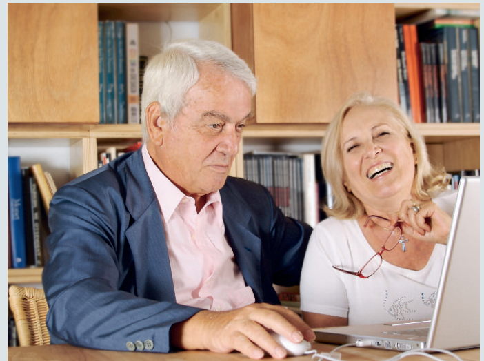
Wohnen im Alter.

→ Ihr Nutzen: Anschlüsse mit Sicherheit dort wo sie gebraucht werden