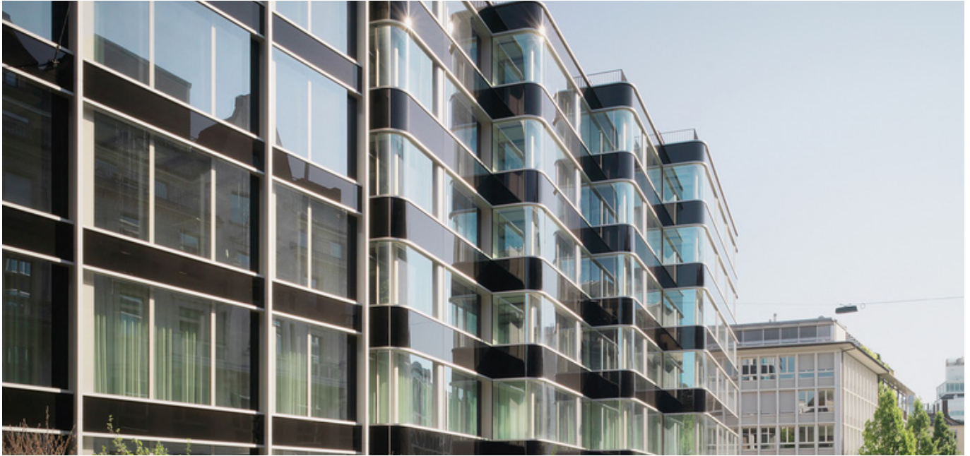
Die modernen und von Glas geprägten Immobilien im Zürcher Kreis 1

Die Gebäude an der Brandschenkestrasse 24 und 30 in Zürich wurden gesamtsaniert. Dafür wurde die swisspro mit dem Grund- sowie dem Mieterausbau für Lenz & Staehelin, den neuen Mietern der Räumlichkeiten, beauftragt.